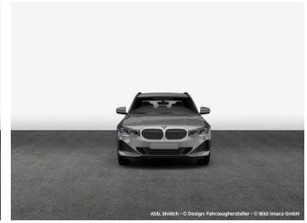
Abb. ähnlich - © Design Fahrzeughersteller - © BMW Imaca GmbH