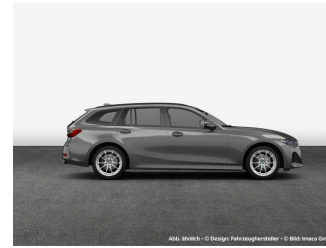
Abb. ähnlich - © Design Fahrzeughersteller - © BMW Imaca GmbH